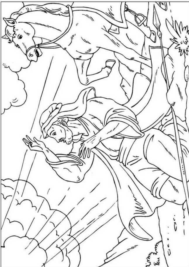
SAULUS OP WEG NAAR DAMASCUS.